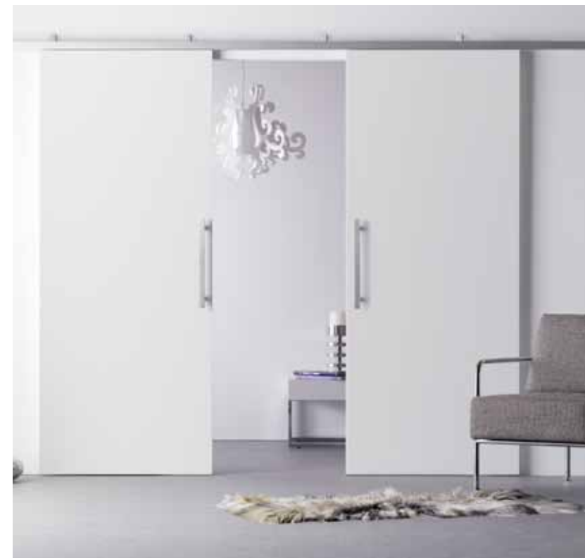
GLATT Standardtüren als Schiebetür.