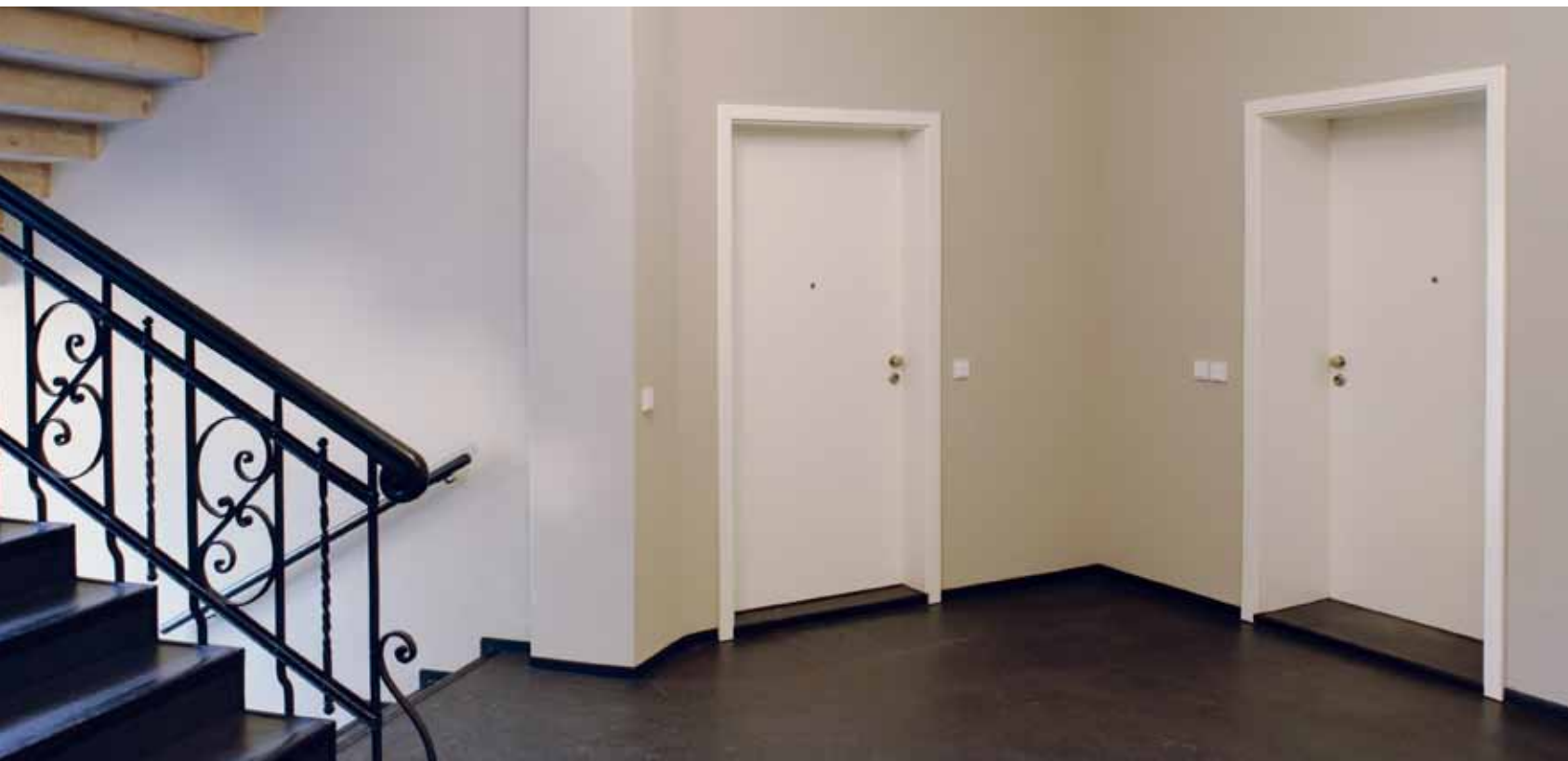
Funktionstüren im Wohnungseingangsbereich

Zur Sache: Die GLATT Standardtüren sind auch als Funktionstüren erhältlich. Je nachdem, welche Funktion sie erfüllen sollen, sind sie technisch mit Brand-, Rauch- oder Schallschutz ausgestattet oder bieten eine Einbruchhemmung – das ist die offizielle Definition laut Norm. Und auch klimatisch wirken die Standardtüren nach Wunsch gegen Wärmeverluste. Natürlich kann eine Tür mehrere Funktionen erfüllen. Optisch unterscheiden die Funktionstüren sich aber nicht von 'normalen' GLATT Standardtüren. Ein Vorteil, der sich sehen lassen kann.